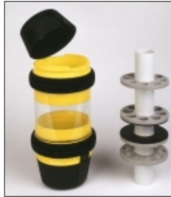
Versandhülle mit Eprouvetteneinsatz

Undichte Probenbehälter oder Eprouvetten können dazu führen, dass kontaminierte Flüssigkeiten aus Versandhüllen austreten und das Fahrrohr verunreinigen. Durch weitere Versandhüllen kann die Verunreinigung auf das gesamte Fahrrohrnetz übertragen werden. Das macht teure und langwierige Reinigungsarbeiten notwendig und kann soweit führen, dass Fahrrohrteile demontiert werden müssen und das System für längere Zeit lahmgelegt ist.